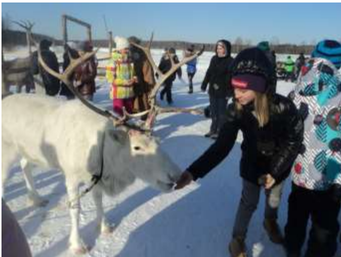
Катались в оленьих упряжках;