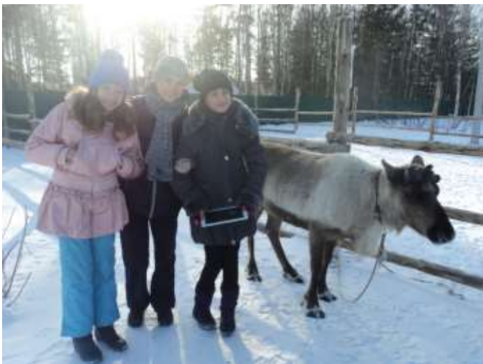
Наши ученики кормили оленей хлебом и мхом ягелем;