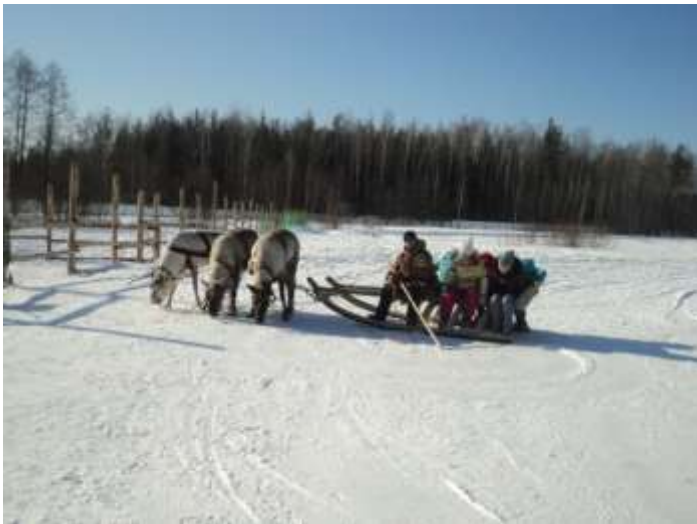
Принимали участие в играх народов севера;